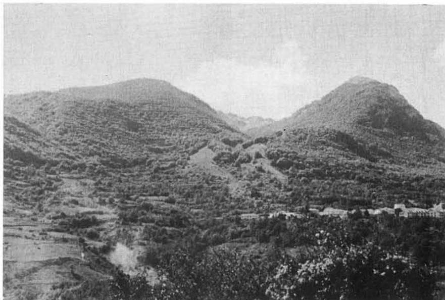
FIG. 6 - In secondo piano la parte terminale della Valle di Rose con caratteristico profilo a U. Al centro i depositi del probabile rock glacier di Val di Rose, riferiti alla fine del secondo evento glaciale.

e il Monte La Meta (2 242 m) nelle parti alte di Valle Cupella, Valle Lunga, Valle dei Tartari e Valle Pagano. Fra i depositi morenici riferiti a questo secondo evento si distingue quello rinvenuto all'uscita della Valle di Rose (vedi fig. 6), che si estende tra 1 500 e 1 200 m di quota. Esso risulta limitato lateralmente da due dorsali strettamente affiancate che, aggirando l'ostacolo costituito dal Monte Mava, descrivono una leggera curva verso monte e scendono verso il Lago di Barrea fino ad una quota di 1 200 m. La formazione di questi «depositi morenici», caratterizzati dall'abbondanza di detrito angoloso immerso in matrice molto scarsa, e dalla presenza di lobi e archi in superficie, viene riferita allo scioglimento di una piccola lingua glaciale molto carica di detrito (o rock glacier ?) avvenuto alla fine del secondo evento. Nello stesso evento è da inquadrare il modellamento della valle posta alle sue spalle che presenta chiaramente le caratteristiche di un truogolo. Uscendo da Val Iannanghera si osserva poi un complesso more-