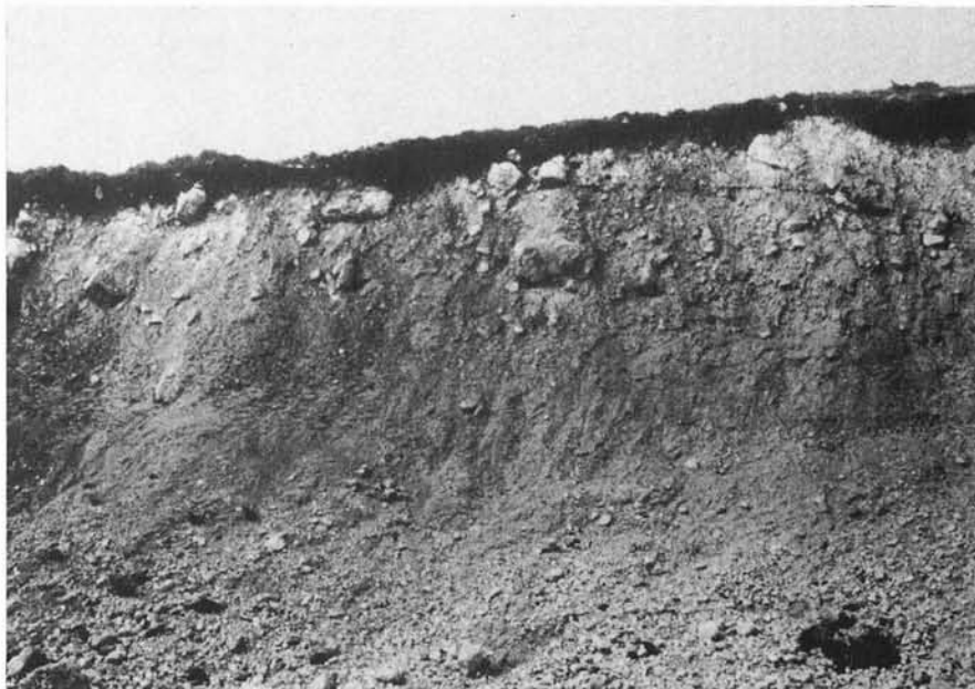
FIG. 3 - Deposito morenico che affiora nei pressi di Fonte La Guardia ad una quota intorno a 1 500 m. In corrispondenza di questo taglio la morena, riferita al primo evento glaciale, risulta esposta per uno spessore di circa 10 m. Nella parte medio-inferiore della parete si osservano alcuni accenni di un modesto rimaneggiamento.

renici si presentano in buono stato di conservazione, costituendo dei dossi regolari coperti di erratici ed allungati parallelamente alle valli. Si distingue un cordone destro, deposto dal ghiacciaio di Peschio di Lordo presso lo sbocco della omonima valle fra 1 400 e 1 275 m. Ai ghiacciai che scendevano dai circhi di Monte La Rocca e Monte della Strega è da attribuire poi la deposizione di un cordone laterale destro e sinistro, che si spingono rispettivamente fino ad una quota inferiore di 1 325 e 1 350 m, e la formazione di un piccolo cordone mediano che si estende a quote comprese tra 1 500 e 1 400 m.