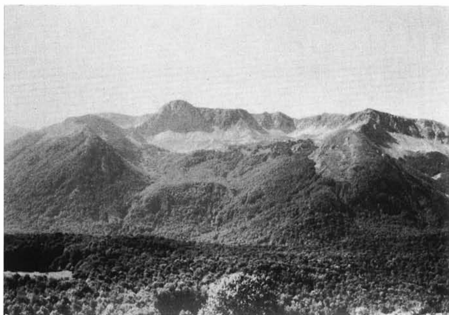
FIG. 5 - Versante orientale della Metuccia (2 105 m) visto dall'altopiano Le Forme. Al centro si evidenziano i contorni di un grande circo con fondo posto a circa 1 700 m, che è stato correlato al secondo evento glaciale. Alle sue spalle, disposti a due livelli, si intravedono altri circhi riferibili ai successivi eventi III e IV.

Un'idea dell'estensione delle aree coperte dai ghiacciai durante questa avanzata danno anche le ampie superfici montonate che si rinvencono sul versante orientale compreso tra il Monte Petroso (2 249 m)