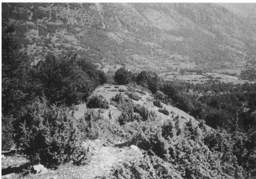
FIG. 4 - Vista dall'alto del cordone laterale sinistro di Val Fredda, correlabile al ghiacciaio composto di Monte Panico-Monte Irto, che scendeva durante il secondo evento glaciale fino ad una quota di 1 150 m. Il cordone ha conservato bene la sua morfologia originaria e presenta la forma classica a dorso di balena.

I circhi, raggruppabili in tre generazioni, occupano la parte medio-alta di due valli tributarie maggiori del Fiume Sangro, la Valle Fredda e la Valle Fondillo. La generazione più antica, riferita al primo evento glaciale, viene rappresentata da ampie conche circoidei non ben conservate, i cui fondi si collocano tra 1 325 ed 1 400 m. A questa genera-