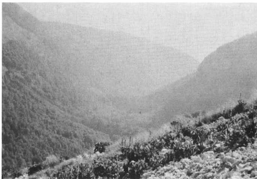
FIG. 7 - La parte alta della Valle di Iannanghera (Val Risione). Nonostante la foschia si evidenzia abbastanza bene il suo profilo ad U, caratterizzato da un fondo vallivo piuttosto piatto e pareti subverticali, che risultano mascherate nella parte medio-bassa dalle falde di detrito.

nico situato tra 1 200 e 1 000 m di quota nella fascia pedemontana posta tra lo sbocco della valle ed il Lago di Barrea. Il deposito non conserva alcuna traccia della morfologia originaria. Distaccato da esso si osservano sulla riva del lago due piccole collinette formate nella parte alta, e per uno spessore di alcuni metri, da un deposito morenico costituito da clasti eterometrici immersi in una matrice arenitica scura, che poggia direttamente sul substrato flyschoido. Circa la loro genesi si ritiene probabile che esse si siano distaccate dal retrostante cumulo morenico perché coinvolte uno scivolamento sul substrato plastico flyschoido. Alla deposizione di tutto questo complesso morenico viene correlato il modellamento glaciale della Valle Iannanghera, che presenta, dall'area di testata fin verso il suo sbocco sulla Valle del Sangro, un profilo regolare e tipico a truogolo (vedi fig. 7). Altre estese coperture di materiale morenico si ritrovano sul versante ad est del Monte La Meta in corrispondenza della conca Le Forme (1 400 m) e nell'area