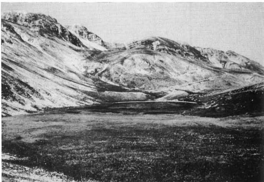
Fig. 2 - La conca del Lago di Pantaniello (1 800 m) situata a N nella dorsale di Serra Le Gravare. Al centro il piccolo arco morenico frontale (1 818 m) riferito al quarto evento glaciale, che, rinforzato artificialmente, va a sbarrare il laghetto. In fondo si intravedono alcuni dei circhi della catena di Serra Rocca Chiarano.